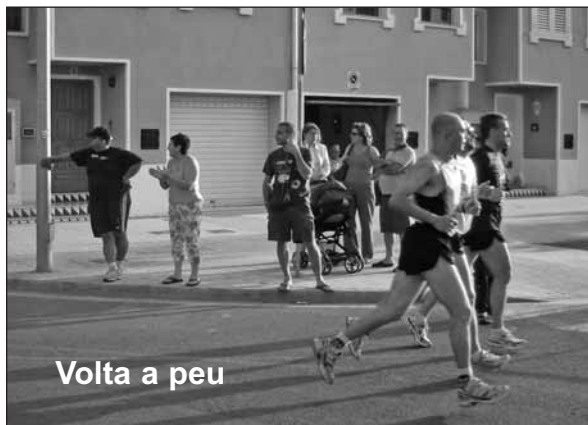
Volta a peu