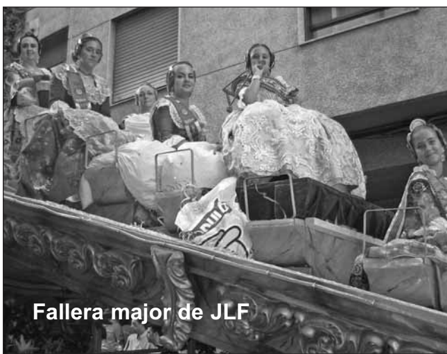
Fallera major de JLF