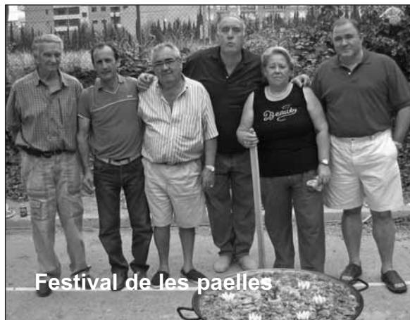
Festival de les paelles