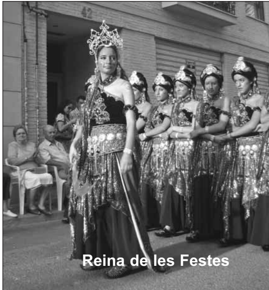
Reina de les Festes