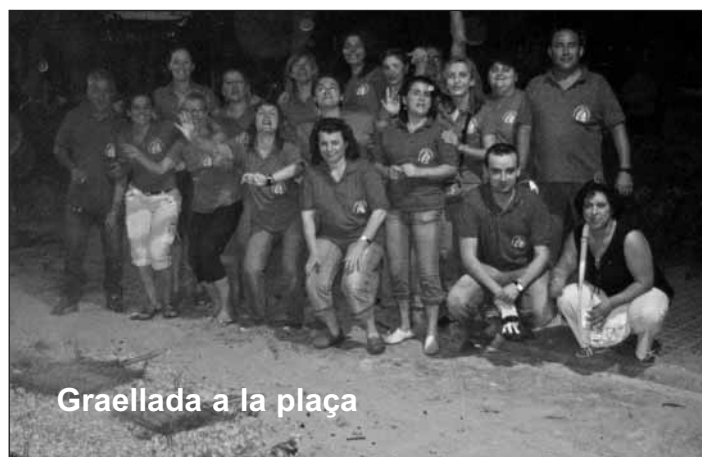
Graellada a la plaça