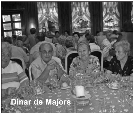
Dinar de Majors