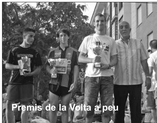
Premis de la Volta a peu