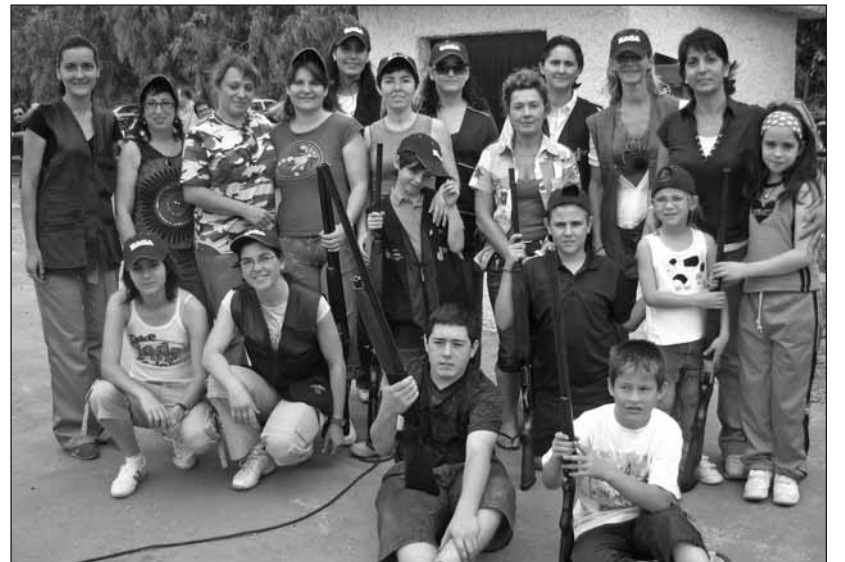
Grup de dones i xiquets participants.