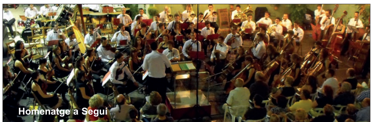
Homenatge a Seguí

Les jornades les van clausurar el Grupo Acénto Ibérico.