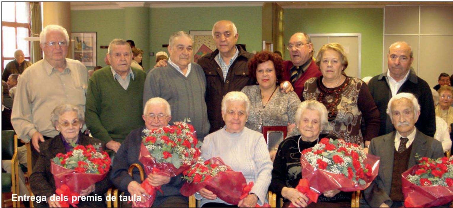
Entrega dels premis de taula