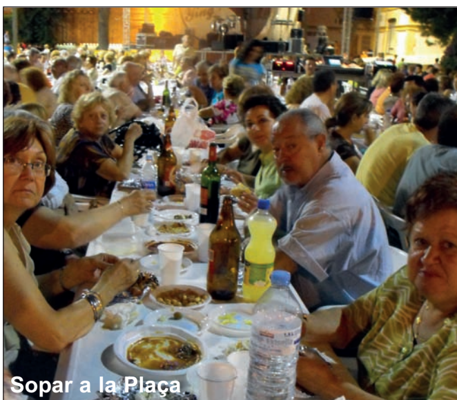
Sopar a la Plaça