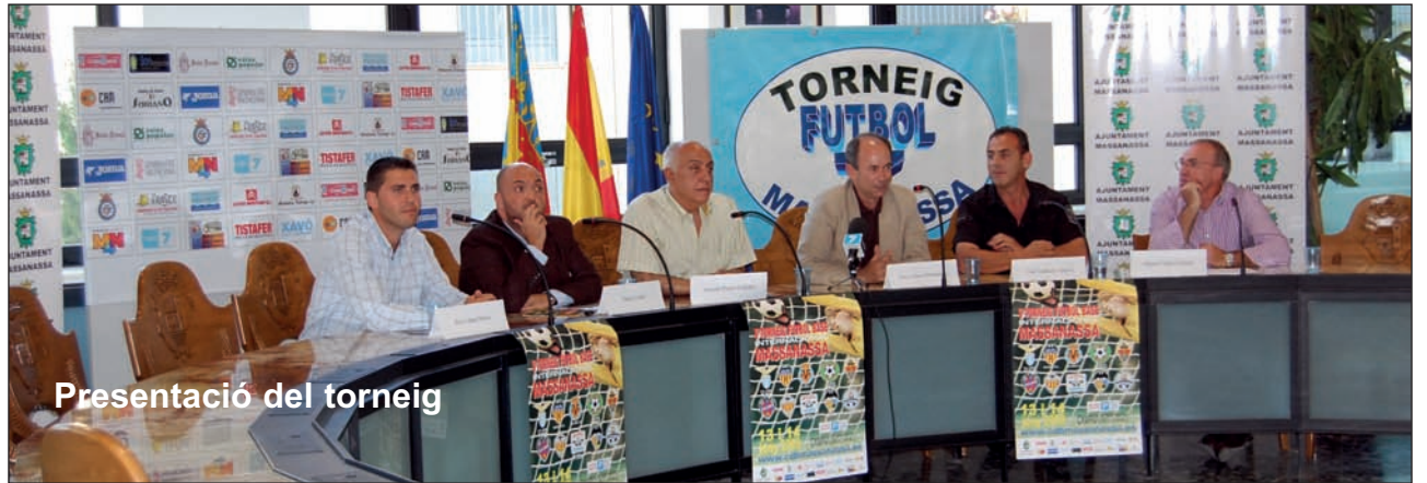
Presentació del torneig

Èxit total en tots els aspectes l'aconseguit este cap de setmana en el Poliesportiu Municipal de Massanassa amb la celebració del V Torneig Internacional Futbol Base Massanassa.