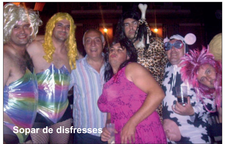
Sopar de disfresses