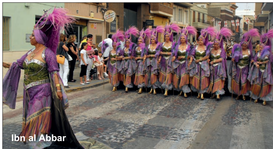
Ibn al Abbar