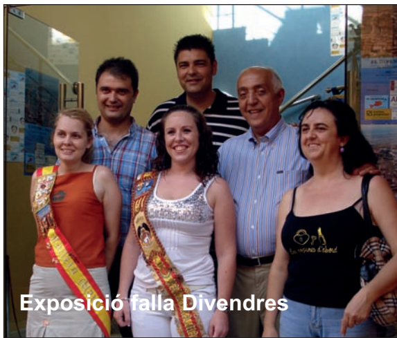
Exposició falla Divendres