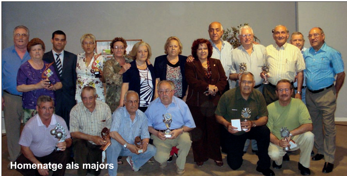
Homenatge als majors