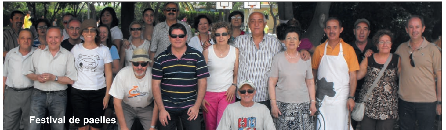
Festival de paelles

Donada la situació econòmica que travessa el país s'ha tingut que reduir considerablement el pressupost i poder destinar eixe estalvi a partides de Benestar Social per atendre les necessitats dels veïns amb menys recursos econòmics. Així i tot s'ha pogut mantindre la qualitat dels espectacles i actes organitzats que han comptat amb una gran afluència de públic com demostren les fotos del reportatge gràfic.