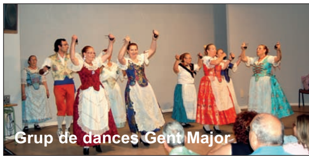
Grup de dances Gent Major

Enguany el dinar de germanor es va celebrar a un restaurant de El Palmar. Previament els majors gaudiren d'un passeig en barca pel llac de l'Albufera.