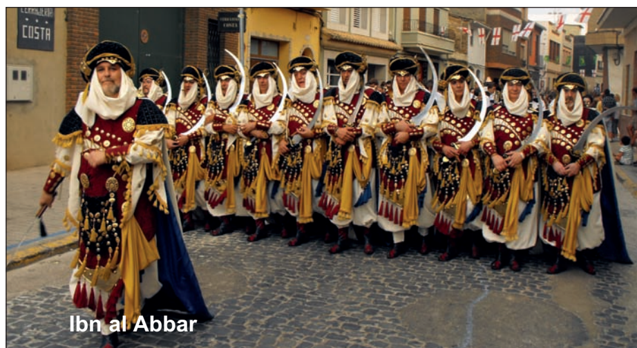
Ibn al Abbar