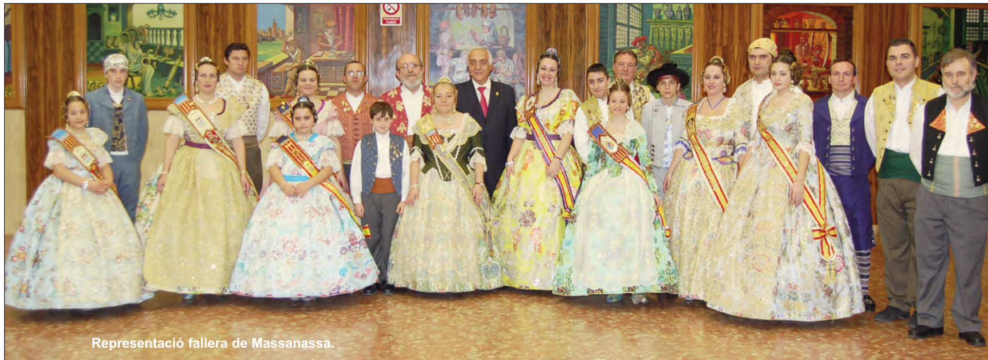
Representació fallera de Massanassa.