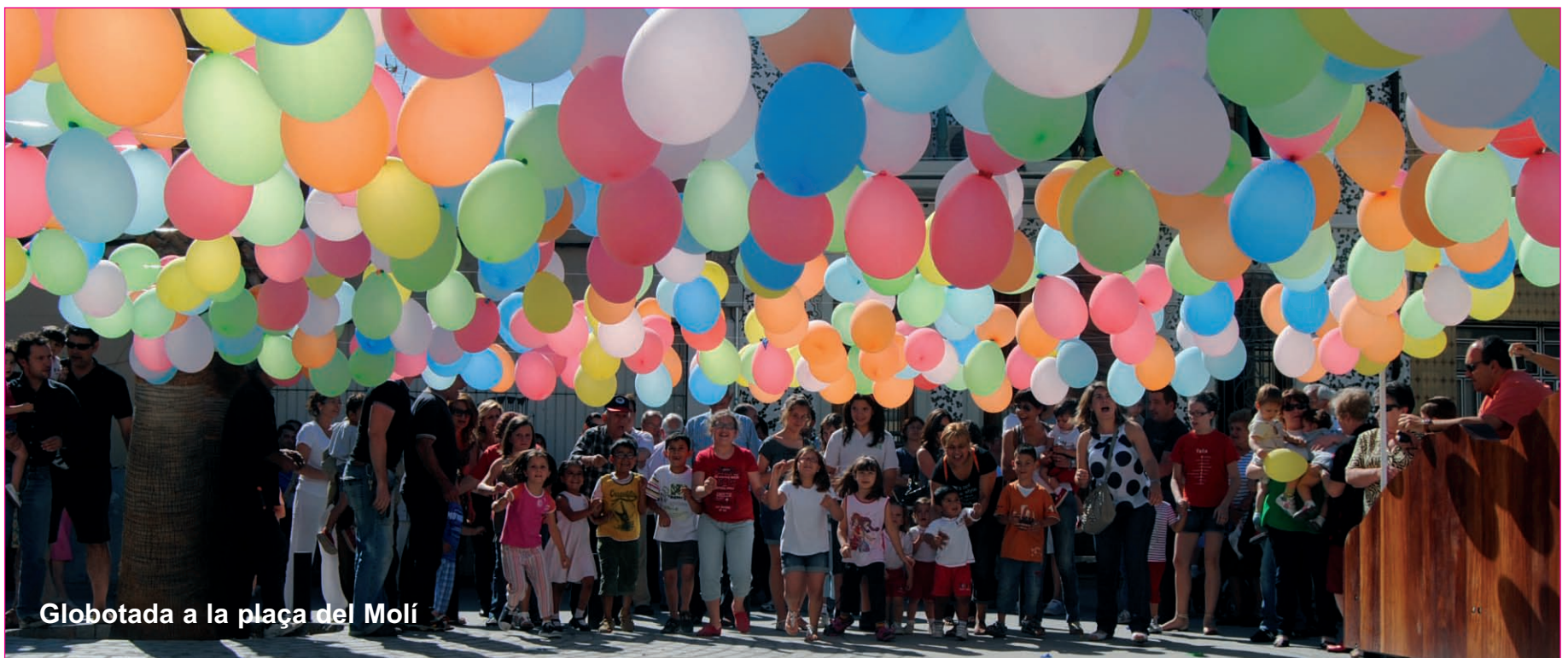
Globotada a la plaça del Molí