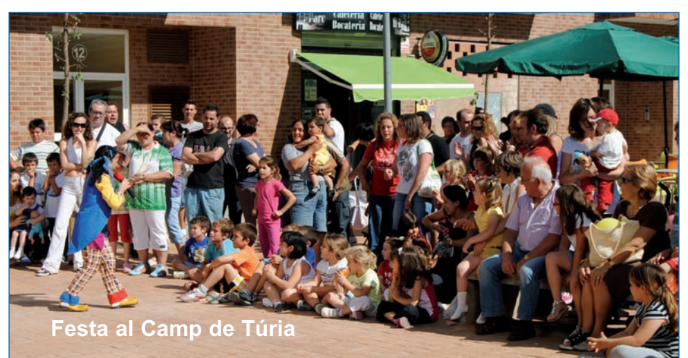
Festa al Camp de Túria