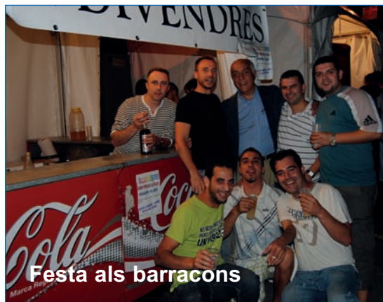
Festa als barracons