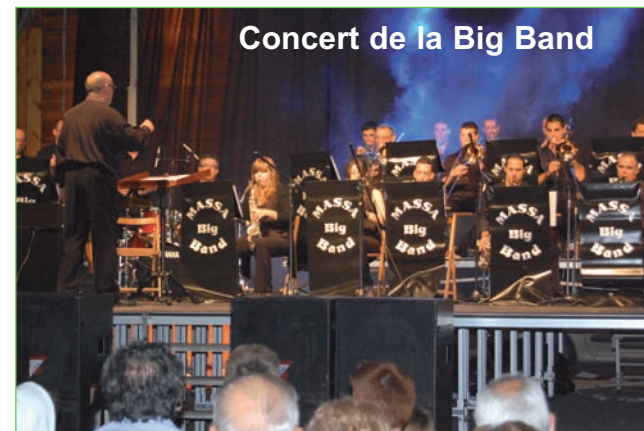
Concert de la Big Band