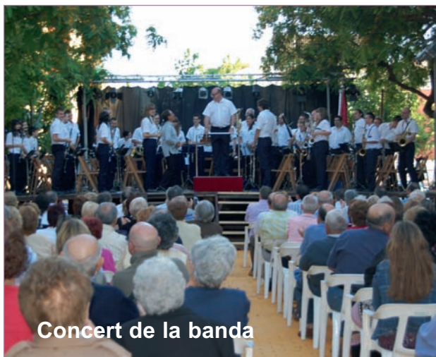
Concert de la banda