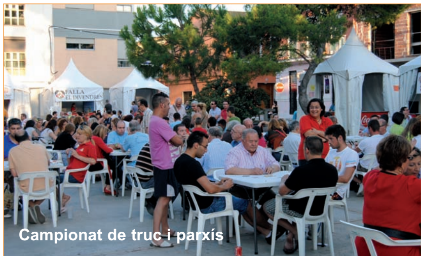
Campionat de truc i parxis