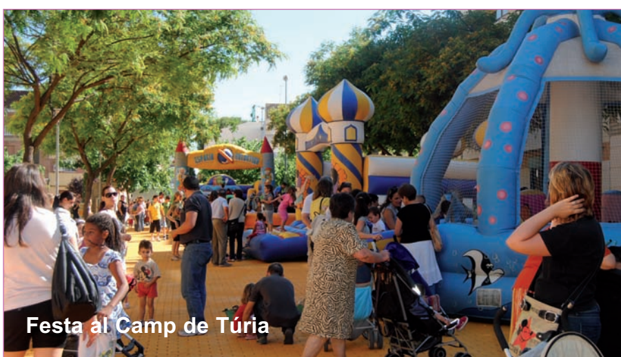
Festa al Camp de Túria