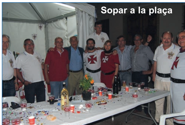
Sopar a la plaça