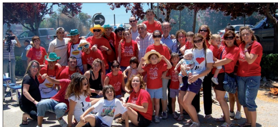
Festival de paelles al poliesportiu