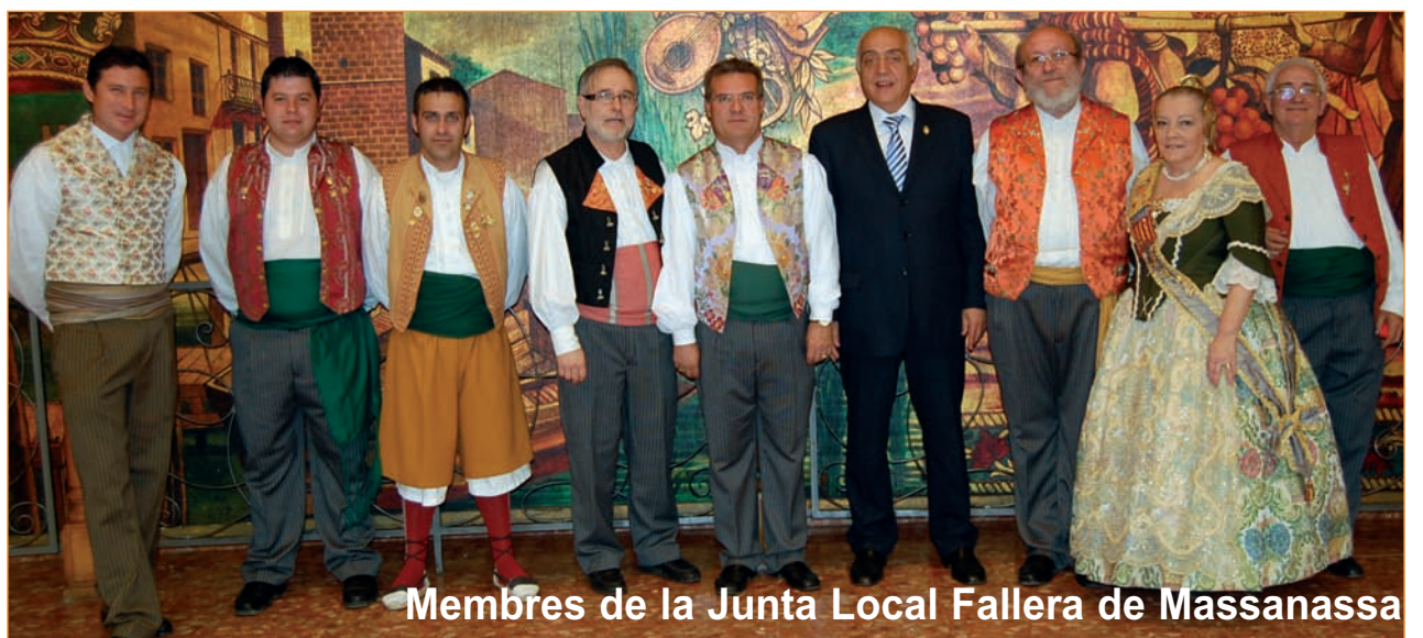
Membres de la Junta Local Fallera de Massanassa

19 de març, a les 12.45 hores, missa en l'església de Sant Pere.